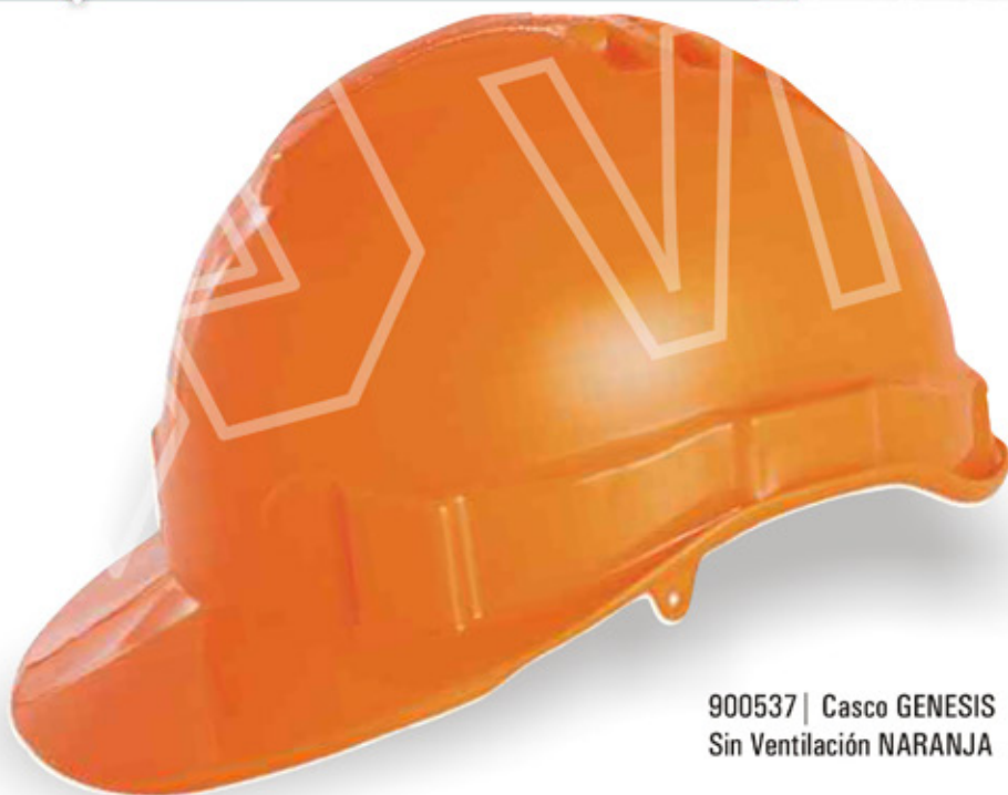
900537 | Casco GENESIS Sin Ventilación NARANJA

ANSI/SEA Z89.1-2009 TYPE I-CLASS E NBR 8221:2003 IRAM 3620 TIPO 1-CLASE B UNIT 687-83 TIPO 1 COVENIN 815:1999